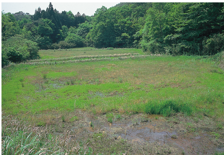
ほろきでん あけうこうでん 94. 放棄田 (休耕田)